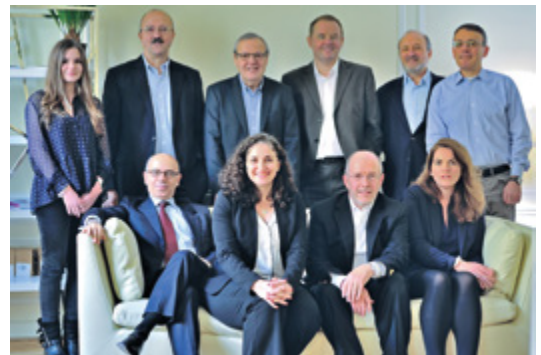
L'équipe de Talents & Projets

Fort d'une expertise reconnue dans l'accompagnement de projets à la fois critiques et urgents, Talents & Projets mobilise sous des délais extrêmement courts des profils chevronnés, et minutieusement sélectionnés au sein de son réseau, pour répondre aux exigences de ses clients. C'est d'ailleurs la réactivité et la qualité des parcours mobilisés qui fondent l'approche du cabinet, dont la marque de fabrique est de conjuguer urgence et excellence. Les dirigeants et managers délégués chez les clients sont issus de la plupart des grands secteurs, où